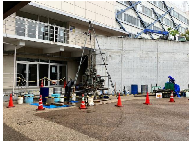
地質調査作業場業写真