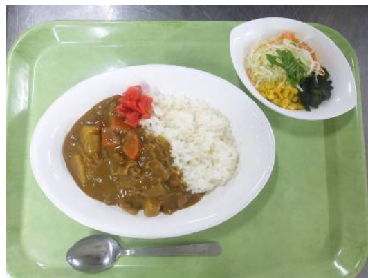
野菜ごろごろカレー(380円)

高校食堂は5月20日(月)~22日(水)までお弁当大盛無料キャンペーンを行います。ご飯をたくさん食べたい方は、この機会にぜひご利用ください。