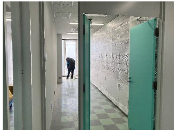
八木山キャンパス 10号館 8階 総合教育教員室内装仕上げ