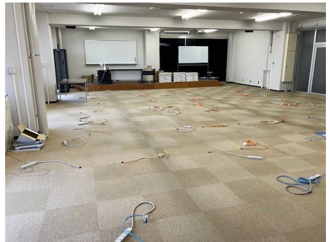
机・椅子・備品撤去作業後